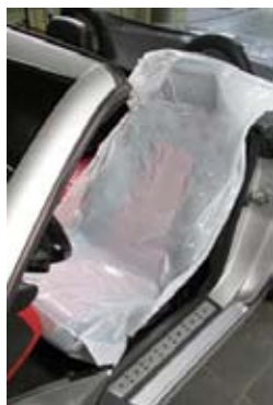
Sittskydd På rulle 250st SE-0990221