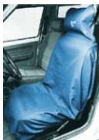
Sittskydd Galon JL-1064