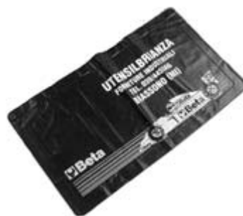
Skärmskydd BT-9512-B Skärmskydd magnet GA-0100701