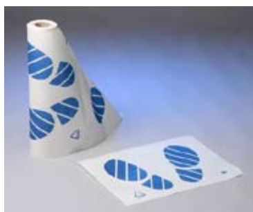
Golvskydd 250st på rulle SE-0990531